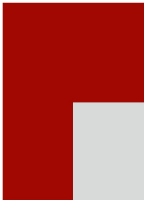
1/4 Seite Eck 100 x 148 mm