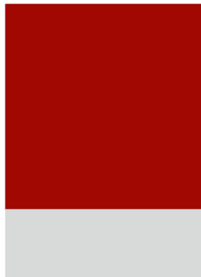
1/4 Seite quer 200 x 79 mm