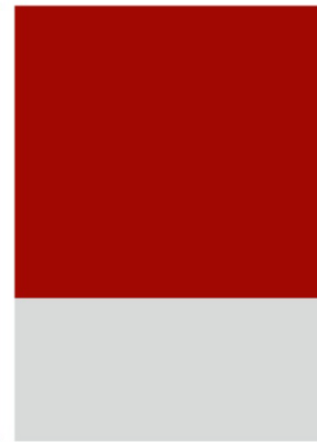
1/3 Seite quer 210 x 102 mm