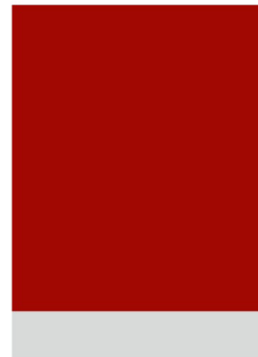
1/8 Seite quer 210 x 45 mm