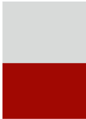
1/2 Seite quer 210 x 148 mm